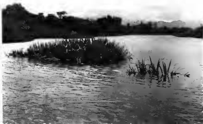
Pl. 3. — Pandanus peyeriasii Stone et Guillaumet : en haut : au milieu et sur les bords (à gauche) d'un petit fleuve côtier, entre Fort-Dauphin et Manantenna; en bas : Nord de Manantenna.